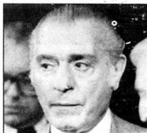
VINCENT COTRONI, le parrain respecté, est décédé il y a presque 15 ans.

À partir des années 1950 jusqu'à la fin des années 1970, Vincenzo Cotroni était le parrain le